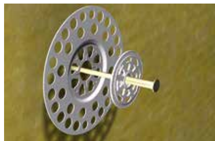
Pannello isolante soffice