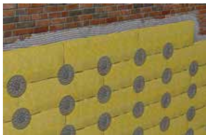
Rondella addizionale per pannelli isolanti soffici